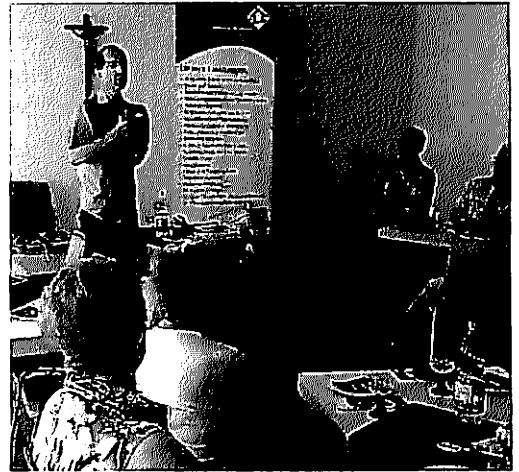
Vorstellung des Notrufgerätes

Der Vortrag war sehr ausführlich und verständlich und hat manche mögliche Situationen dargestellt.